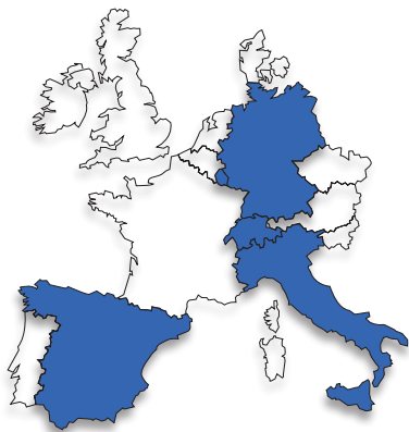
■ Países limítrofes concernidos por las prohibiciones